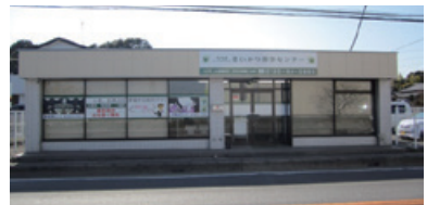
春日部・白岡家族葬ホール

春日部・白岡営業所 : 白岡市太田新井568-4 0480-31-6975 本社 : 越谷市増林5918-1 代表 048-960-7370