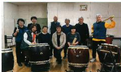
取材時の感想：お腹の底に響き、静寂を切り裂かれるリズム 庄善!!