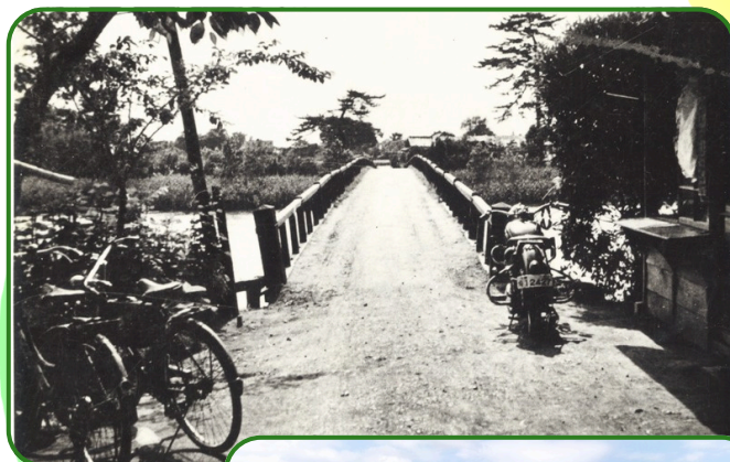
昭和25年頃の藤塚橋↓

藤塚橋は、木造の橋で、幅は3.63mしかなく、当然大型の車両は通行できませんでした。