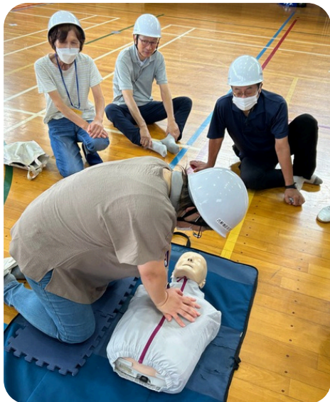
豊野地区の防災訓練