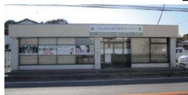
春日部・白岡家族葬ホール

春日部・白岡営業所 : 白岡市太田新井568-4 0480-31-6975 本社 : 越谷市増林5918-1 代表 048-960-7370