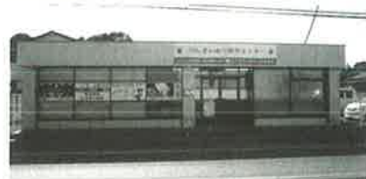
春日部・白岡家族葬ホール

春日部・白岡営業所 : 白岡市太田新井568-4 0480-31-6975 本社 : 越谷市増林5918-1 代表 048-960-7370