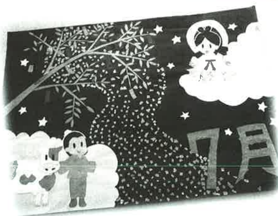
あおぞらの皆さんの作品