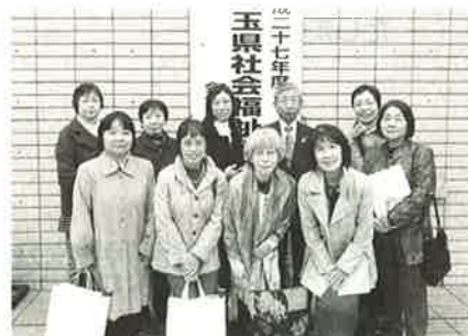
ご出席された皆様