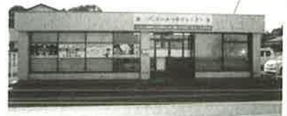
春日部・白岡家族葬ホール

春日部・白岡営業所 : 白岡市太田新井568-4 0480-31-6975 本社 : 越谷市増林5918-1 代表 048-960-7370