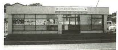
春日部・白岡家族葬ホール

春日部・白岡営業所 : 白岡市太田新井568-4 0480-31-6975 本社 : 越谷市増林5918-1 代表 048-960-7370