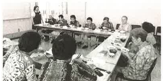
ふれあい会食会の様子